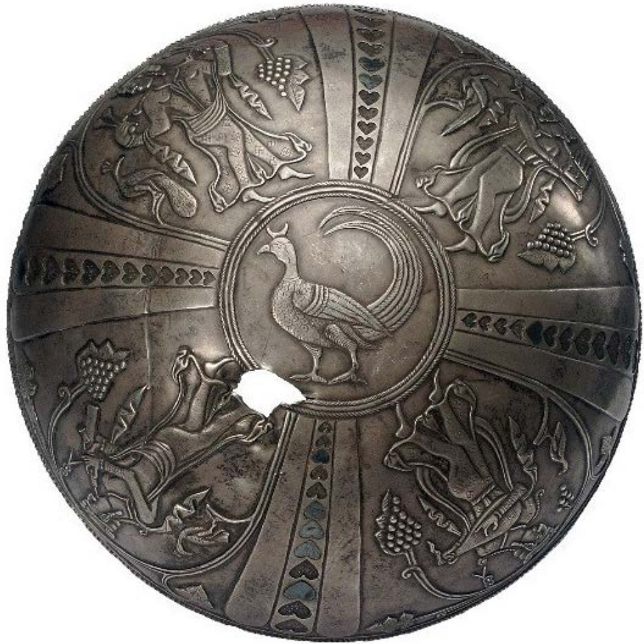
تصویر ۱۰. نگارهٔ چهار رامشگر (سه مرد و یک دختر/زن) با لباس ضخیم.

موزهٔ ملی با نگارهٔ نوازندگان-رقاص، هم‌سان با دو کاسهٔ دیگر موجود است که هرگز مورد بررسی قرار نگرفته است.