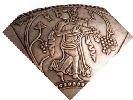
تصویر ۳. مرد عودنواز.

هستند: ارغنون بادی ۲ (نرینه، تصویر ۲)، عودنواز (تصویر ۳)، شرنانواز نرینه (با گونه خاص در اینجا تصویر ۵) و قاشقک نواز (یا سازی همانند انبرک‌های با سر پهن): دختر-زن (تصویر ۴).