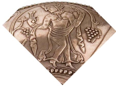
تصویر ۴. دختر-بانوی نوازندهٔ سنج دسته‌دار.

متون زرتشتی به زبان پهلوی داده‌هایی قابل‌توجه از این سازها را به دست داده است؛ هرچند نه نگاره و نه گزارشی از «سنج» در کران شمال (شرقی) شاهنشاهی ساسانی در دست نداریم، اما برخی سازهای دیگر از راه یادگارنوشته‌های مانوی و سغدی آشنا هستند (Gulasci, 2001: 93; Boyce, 1977: 60؛ قریب، ۱۳۸۵: ۱۰۳۹۵، ۱۰۹۵۶). سرنای چنگ، نی‌انبان(?) و دایره‌زنگی در نقش برجستهٔ تاق‌بستان در کرمانشاه شناخته شده (Fukai & Horiuchi, 1969: XCVI, LXX) هستند. چهارم و از همه مهم‌تر، تنها سه نفر از این چهار رامشگر نگاریده شده بر روی این کاسه، مرد، و یک نفر دیگر دختر-زن است. نگارنده تصور دارد که سازهای بادی چون ارغنون بادی، نی‌انبان و سرنای نیز حتی عود سازهای مردانه به‌شمار می‌رفته و سازهای سبک چون دایره‌زنگی، سنج و یا چنگ ایستا را بیشتر زن-دختران می‌نواختند. این موضوع هرگز در مورد این کاسهٔ سیمین دیده نشده است. افزون‌تر، نکته‌های زیر باید مورد توجه افتد که: