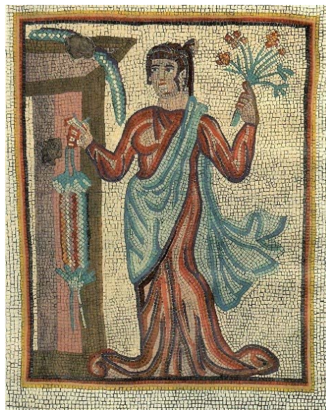
تصویر ۷-۸. موزاییک‌های ساسانی (گیرشمن: ۱۳۷۸).