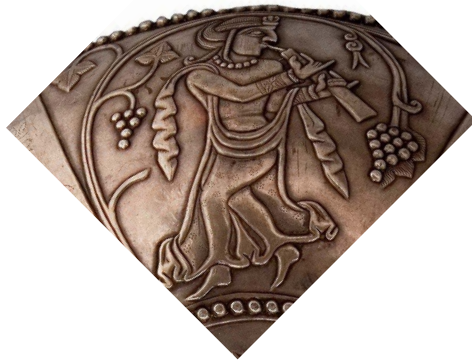
تصویر ۵. مرد سرنانواز.

سه‌دیگر، نگارنده در به‌کارگیری واژهٔ فلوت (کاتالوگ وین) نیز برای این ابزار (تصویر ۵) گمان‌مند است. پهنای این ابزار، دو ردیف انگشتی که برای تولید موسیقی بلند و خمیده شده‌اند، گواهی این ادعا است. افزون‌تر، زبانکی کشیده میان بدنهٔ ساز و لب‌های نوازنده دیده می‌شود که نی‌های معمولی فاقد آن هستند. پهنای نوع زبانه و سر نسبتاً گشاد آن می‌تواند یادآور نوعی خاص از سرنای ایرانی باشد. این دست‌سرنای در کران جنوب‌غربی (البته دیگر کرانه‌ها به‌گمانی) بسی رایج بوده و هم‌اکنون نیز در بخش‌هایی از استان‌های چهارمحال و بختیاری تا فارس قابل‌فهم است. «مسعودی» (سامی، ۱۳۴۹ الف: ۲۹) به نقل از «ابن‌خردادبه» می‌نویسد که: «ایرانیان نی را ابداع کردند که با نوعی عود نواخته می‌شود و نی جفتی با تمبور.»