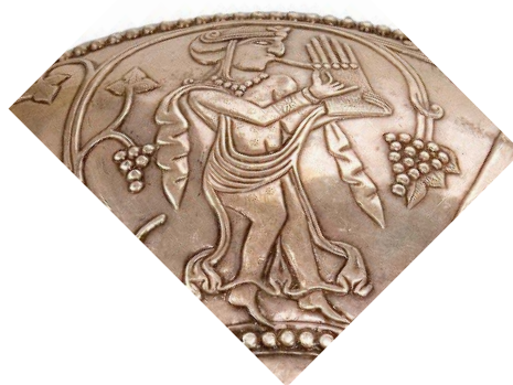
تصویر ۲. مرد ارغنون نواز.

نگارنده ترجیح می‌دهد تا به جای قاشقک، از سنج دسته‌کوتاه/سنج دسته‌دار (تصویر ۴) استفاده کند. سنج‌های کوچک هنوز نیز به شکل دسته‌دار (کوتاه) و نیز انگشتی در جنوب ایران از جمله استان‌های خوزستان، بوشهر، هرمزگان تا به سیستان و بلوچستان روایی دارد. خاستگاه این‌گونه سنج‌ها کشور هند بوده (درویشی، ۱۳۹۰: ۵۳۶) است. دست‌کم، اندازه، شکل و ملودی (تولید ساز) هردو یکی است. این ابزار موسیقی برای تولید نوعی ریتم و هم‌آوایی کاربرد دارد، ۴ همان‌گونه‌که از نگاره دختر-بانوی این کاسه می‌توان فهمید. هم‌اکنون نیز دختر-بانوان بسیاری به نواختن سنج در کران دریای پارس چیره و خبره هستند.