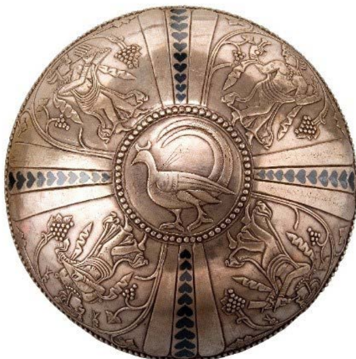
تصویر ۱. نمای بیرونی کاسه.

هستند: ارغنون بادی ۲ (نرینه، تصویر ۲)، عودنواز (تصویر ۳)، شرنانواز نرینه (با گونه خاص در اینجا تصویر ۵) و قاشقک نواز (یا سازی همانند انبرک‌های با سر پهن): دختر-زن (تصویر ۴).